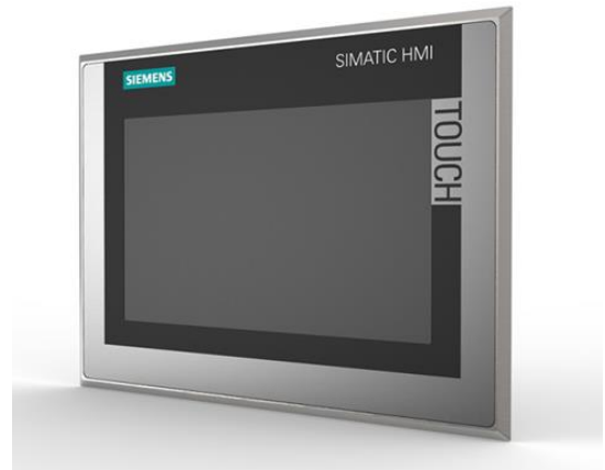
Bedieneinheit TP1200 Comfort Inox